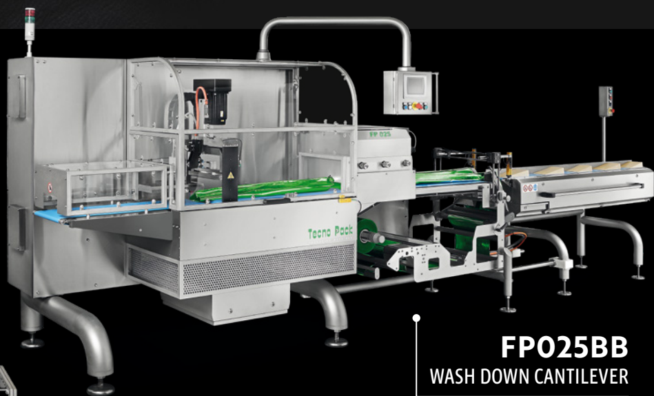
FP025BB WASH DOWN CANTILEVER

Tecno Pack S.p.A. mette a disposizione la propria tecnologia con FP025 per creare un vestito su misura per ogni tipo di formaggio.